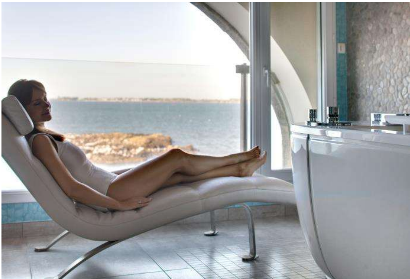
Des salles de soin au spa avec pour certaines vues sur la mer