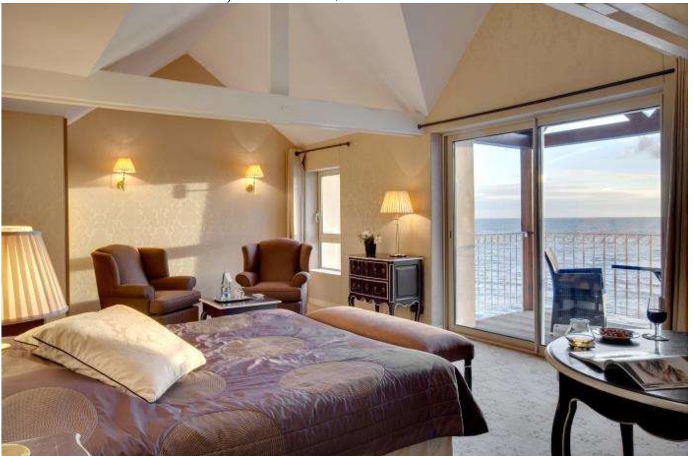
Junior suite avec vue...