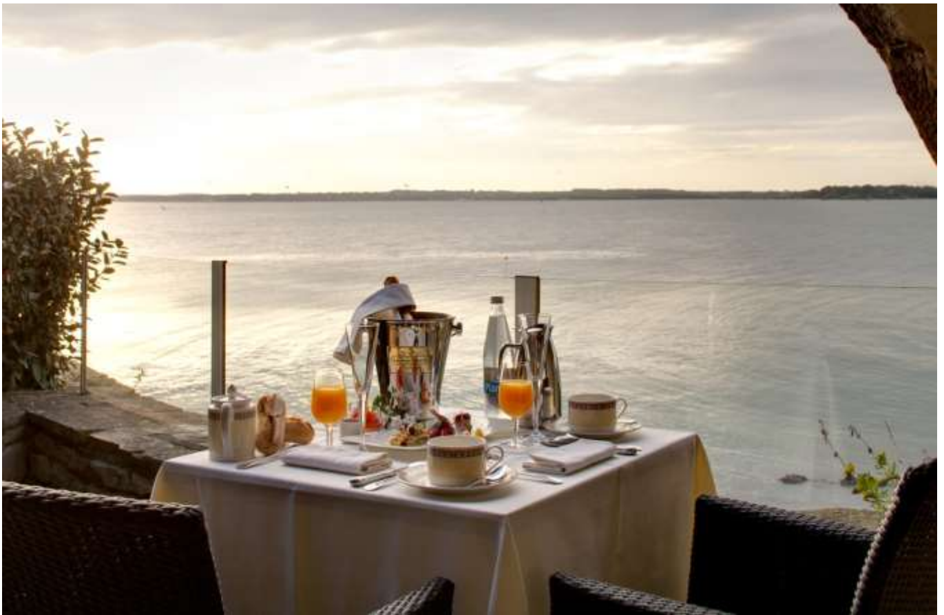
Les déjeuners du matin, une ode au terroir breton