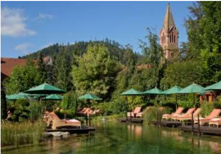
Un bassin naturel dans son écrin de verdure

Quelques exemples des différentes installations lovées dans une nature préservée :