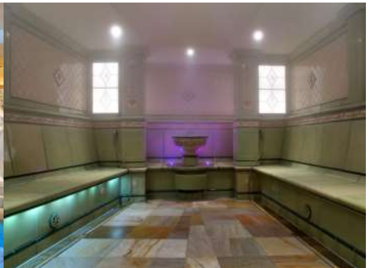
Un bain de vapeur aromatique