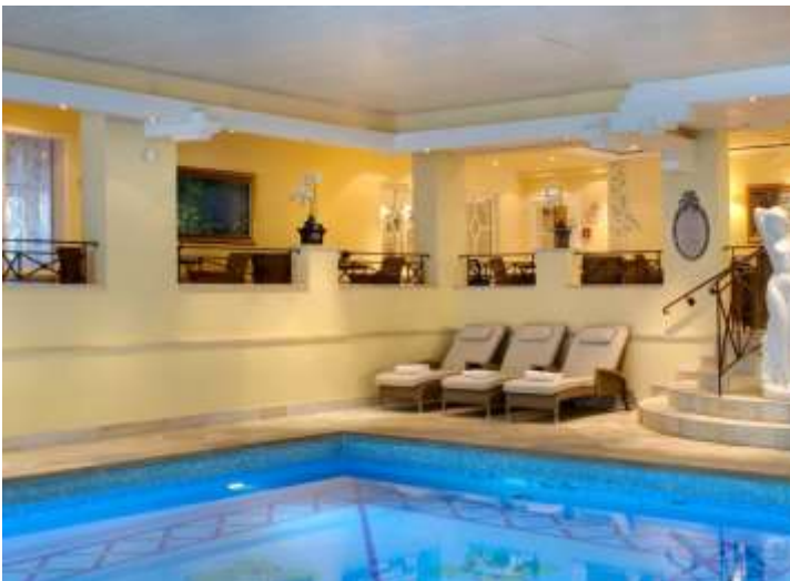
5 piscines (d'eau douce et d'eau de mer)