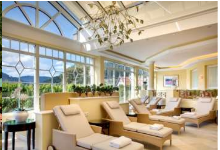
Des aires de repos avec lits aquatiques