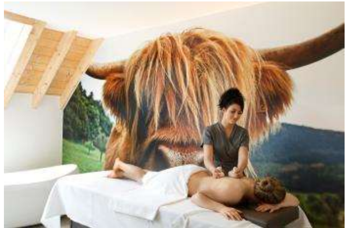
La Suite « Prairie » et sa vache Spaquerette